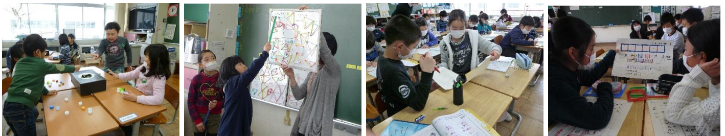
〈三学期の授業の様子〉

103名のすべての子どもたちがしっかり力を付けて進級・進学できるように指導・支援しますので、保護者の皆様方も陰ながら子どもたちを応援してください。そして、明るく爽やかな「春」を迎えましょう。