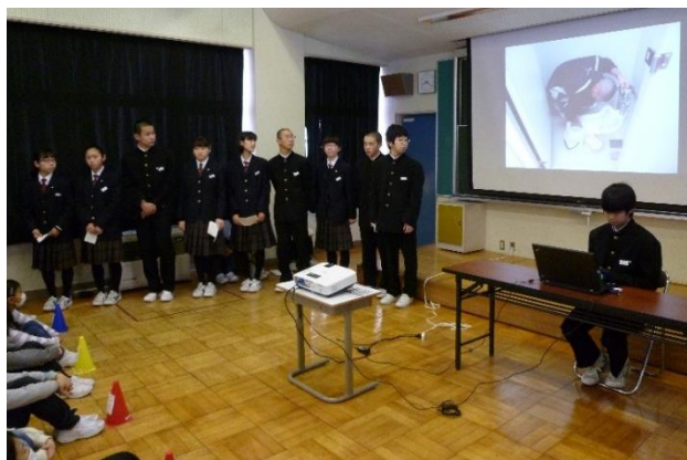
【東郷小学校の児童に伝えたいこと】

すみずみまで掃除場所を見てほしい きれいにしたつもりでも見落としているところがあります