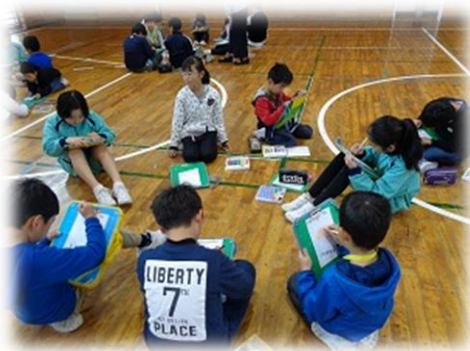
< お互いに似顔絵をかきました >