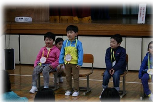
< 元気に自己紹介 >