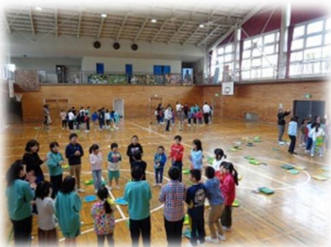
< 1年生も一緒に、みんなでゲーム >