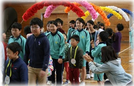
< 6年生と手をつないで入場 >

児童会のリーダーを中心に、子どもたち自身で企画・運営した、心温まる会になりました。